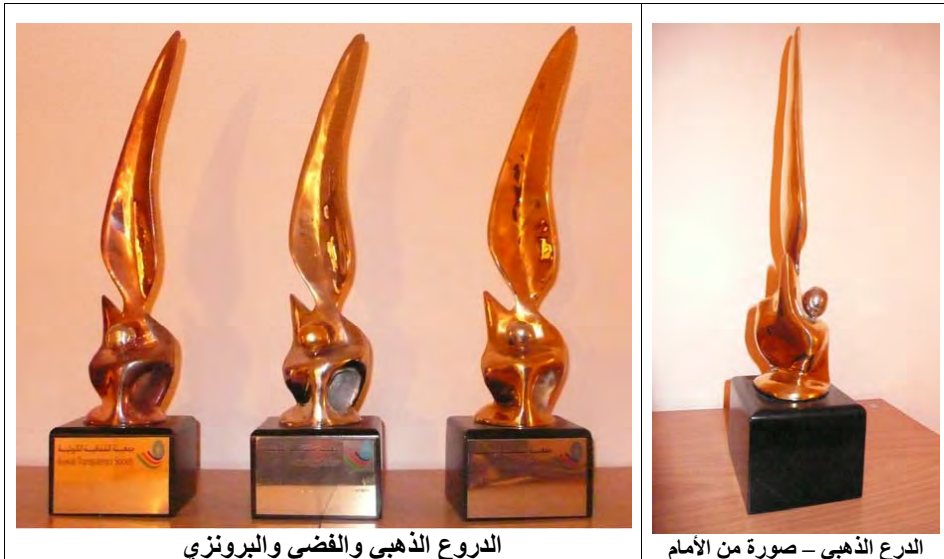
الدرع الذهبي والفضي والبرونزي