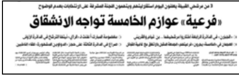
جريدة الراي – 2009/4/4م

وقد أشدنا في التقريرين الثاني والثالث بوزير الداخلية والوزارة الذين أكدوا في أكثر من مناسبة عزمهم تطبيق القانون بحزم في منع الانتخابات الفرعية، فهل قامت الوزارة بدورها في تطبيق القانون مع حالات الانتخابات الفرعية؟