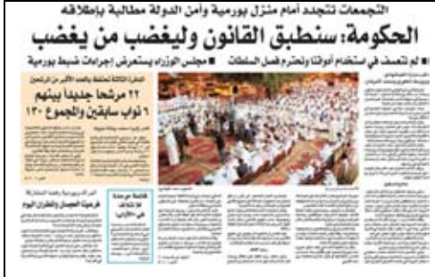
جريدة القيس - 2009/4/18م

- وفي قضية أخرى، شن المرشح د.ضيف الله بورمية هجوما شخصيا على النائب الأول لرئيس مجلس الوزراء الشيخ جابر مبارك الحمد الصباح، بعد أن انتشرت أقاويل باحتمال تكليفه من قبل حضرة صاحب السمو بتشكيل ورئاسة الحكومة القادمة بعد الانتخابات، وقد استخدم عبارات خرجت عن تقييم أداء الرجل إلى تقييم شخصه بأوصاف قد تحط من مكانته، كما أن تكليف رئيس مجلس الوزراء هو من اختصاص سمو الأمير وحده، وكان أسلوب المرشح غير مقبول ويؤدي إلى زيادة الشحن السلبي في نفوس الناخبين وغيرهم.