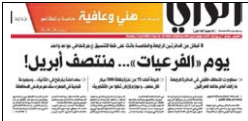
جريدة الراي – 2009/4/2م

الصحف كانت تنشر أخبارها، وهذا مما يعنى سلبية الانتخابات الفرعية، حيث تزيد من حدة المشكلة العصبية وأثرها السلبي على المجتمع، فبعد تقسيم المجتمع إلى قبائل، صارت القبيلة مجزأة إلى أفخاذ، وفي النهاية كانت الرسالة واضحة لمنظمي الانتخابات الفرعية: إن تجاوز القانون في تنظيم الانتخابات الفرعية مسموح به.