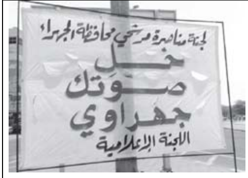
جريدة الأنباء – 2009/5/3م

– برزت ظاهرة جديدة في ظل الدوائر الخمس، وهي المناطقية، كرديف للقبليّة والطائفية، فقد شكل بعض أهالي محافظة الجهراء "لجنة مناصرة مرشحي محافظة الجهراء" تدعو الناخبين إلى توجيه أصواتهم إلى المرشحين من أهل الجهراء، وقد نشأت هذه الظاهرة بسبب مباشر لقانون الدوائر الانتخابية الخمس الذي ضم محافظتين في دائرة واحدة، وكان نصيب محافظة الجهراء في انتخابات 2008م مقعد واحد من المقاعد العشرة التي سيطر عليها تسعة من سكان محافظة الفروانية.