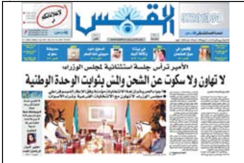
جريدة القبس - 2009/4/13م

و كتبت جريدة القبس في صدر صفحتها الأولى يوم 2009/4/11م افتتاحية بعنوان: (لغة التصعيد لا تفيد)، عكست الخوف من جر البلد إلى منزلق خطير لأسباب انتخابية ومصالحة شخصية.