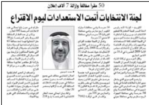
جريدة الوطن - 2009/5/12م

الكويت بإصدار ترخيص لكل مرشح بإقامة مقرين انتخابيين أحدهما للذكور والآخر للإناث يسمح فيه بإجراء الندوات الانتخابية للمرشح والدعوة إليها، وذلك اعتباراً من تاريخ نشر المرسوم أو القرار بالدعوة للانتخابات في الجريدة الرسمية.