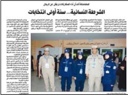
جريدة الراي - 2009/5/17م.