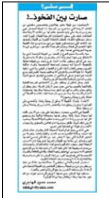
جريدة القيس – 2009/4/7م

من الفائزين فيها بقسمهم فيتحالفون سرا مع مرشحين آخرين من خارج القبيلة التي تعهدوا لها بالالتزام، وبشكل عام، يمكن ملاحظة عزوف مثقفي القبائل عن خوض الانتخابات الفرعية لأسباب شرعية وأخرى قانونية.