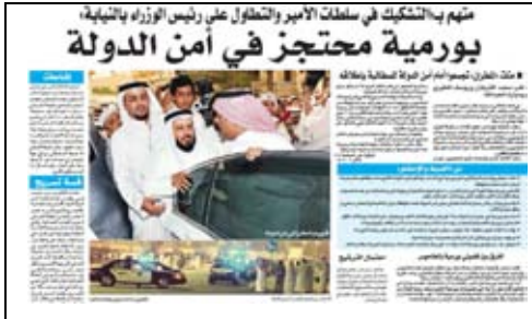
جريدة القيس 2009/4/17م

علما بأن المرشح بقي محجوزا على ذمة التحقيق لعدة أيام، حتى أفرج عنه بكفالة مالية، جرت خلالها الانتخابات الفرعية لقبيلة العجمان التي ينتمي إليها المرشح، وقد فاز في تلك الانتخابات.