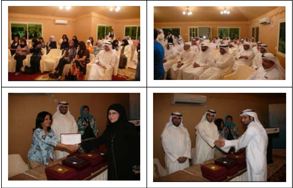
حفل تكريم المتطوعين