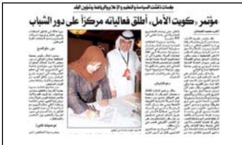
جريدة الوطن - 2009/5/7م.

أصدرت اللجنة تقويماً علمياً لنواب الدائرة الخامسة يقوم على أساس التزامهم بقضايا البيئة خلال وجودهم في مجلس الأمة 2008م، كما أعدت اللجنة ميثاقاً خاصاً ببيئة منطقة أم الهيمان التي فيها الكثير من الملوثات والتي ينعكس أثرها على سكان المنطقة، فبادر العديد من المرشحين في الدائرة الخامسة إلى المشاركة بالتوقيع على ميثاق متابعة التلوث في أم الهيمان، واللافت أن جميع الناجحين العشرة في الدائرة الخامسة في انتخابات 2009م موقعون على وثيقة اللجنة.