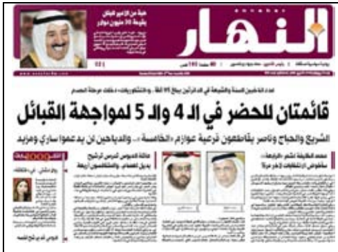
جريدة النهار - 2009/4/5م

ولئن كانت الساحة الانتخابية لم تشهد أي انتخابات فرعية قائمة على أسس طائفية والله الحمد، ولكن من الملاحظ وجود مؤشرات طائفية عديدة من شأنها أن تؤثر على النسيج الوطني الاجتماعي، نستعرضها تباعاً.