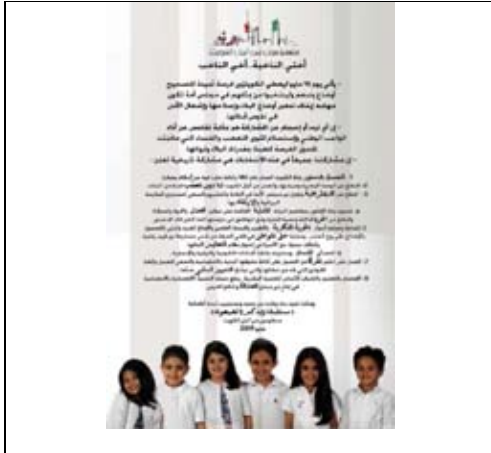
جريدة القيس - 2009/5/16م.