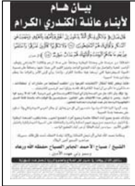
جريدة الوطن - 2009/5/12م

انتشرت في الصحف خلال الأسبوع الخامس - قبل 2009/4/20م - بيانات التزكية التي ينشرها أصحابها للإشارة إلى حصولهم على التزكية من القبيلة، وهي إعلانات غير صحيحة، فالتزكية تتم بالإجماع على شخصية واحدة أو بالامتناع عن المنافسة، ولكن الصحيح هو أن هؤلاء قد خاضوا الانتخابات الفرعية التي يجرمها القانون وفازوا فيها باقتراع شمل العديد من المرشحين المتنافسين في مراكز اقتراع موزعة على أكثر من منطقة سكنية.