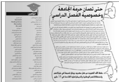
جريدة الجريدة – 2009/5/13م

أصدر عدد من دكاترة جامعة الكويت بياناً صحفياً بعنوان: حتى تصان حرمة الجامعة وخصوصية الفصل الدراسي، وذلك في أعقاب انتشار تسجيل يدعى أنه بصوت المرشحة د.أسيل العوضي وهي تلقي محاضرة في جامعة الكويت، حيث أكد البيان على ضرورة احترام خصوصية الجامعة وعدم إقحامها في المعارك الانتخابية والنأي عن استخدام الطلبة في التجسس على أساتذتهم لتحقيق انتصارات غير صحيحة على خصوم انتخابيين.