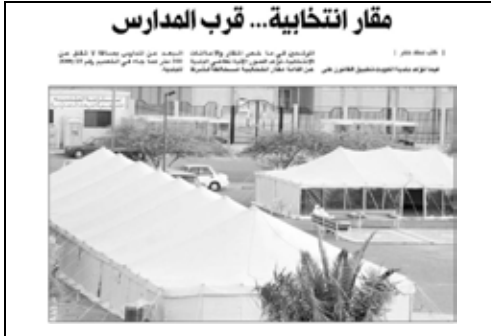
جريدة الناي - 2009/4/20م

نظم القانون رقم 2008/4 الصادر في 2008/1/29م والخاص بتعديل قانون انتخابات أعضاء مجلس الأمة، موضوع المقار الانتخابية للمرشحين، حيث جاء فيه تكليف إدارة الانتخابات بوزارة الداخلية بالتنسيق مع وزارة التربية ووزارة الشؤون الاجتماعية والعمل خلال فترة الحملة الانتخابية بتخصيص مساح المدارس وقاعات تنمية خدمة المجتمع وصالات الأفراح لعقد الندوات الانتخابية لكل من يطلب ذلك من المرشحين وبالسوية بينهم، كما جاء في هذا القانون تكليف بلدية