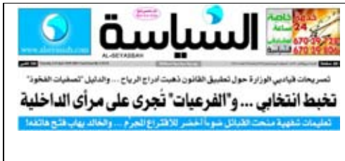
جريدة السياسة – 2009/4/4م

وقد بدأت الصحف المحلية تنشر أخبار انتخابات الفريعات للقبائل في الدائرتين الرابعة والخامسة، مواعيدها والمنظمين لها وأشكال التنظيم، في حين وقفت وزارة الداخلية مكتوفة الأيدي، فبداننا نشاهد الوطن – وبكل أسف – يتمزق قبليا على رأى من أبنائه.