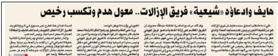
جريدة الدار - 2009/4/12م

– وجه مرشح يمثل تجمع ثوابت الأمة اتهاماً غير مقبول للجنة إزالة التعديلات على أملاك الدولة قال فيه: أن "اللجنة تستعين بعمالين من الشيعة لهدم مساجد السنة" وهذا قول مرفوض بكل الاعتبارات وأقل ما يقال فيه أنه تصريح غير مسؤول، ويشكل جريمة، فهو إن كان صحيحاً فلا يجوز التلطف به لأن العاملين بلجنة الإزالة من أهل الكويت ويأترون بأوامر الدولة، ويرأس اللجنة الفريق المتقاعد محمد البلدر والمنسق العام العميد المتقاعد سعود الخترش، فلا يجوز إثارة الثغرات الطائفية بين أبناء المجتمع حيث يتنافى ذلك مع أبسط المفاهيم الدستورية والقانونية والشرعية.