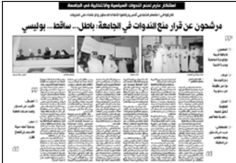
جريدة الراي – 2009/5/4م

قررت إدارة جامعة الكويت منع المرشحين من الدخول إلى الجامعة وإلقاء المحاضرات في هذا الموسم الانتخابي، بحجة عدم انحياز الجامعة لمرشحين دون غيرهم ولأن المنظمات الطلابية تقتصر دعواتها على ممثلين لتيارات سياسية محسوبين عليها، ونرى في المفوضية إن هذا القرار غير صحيح، وإن المنع يجب أن يقتصر على استضافة مرشحين داخل الفصل الدراسي للترويج لبرنامج انتخابي، أو قيام مسؤول جامعي باستخدام موقع عمله للترويج لأحد المرشحين، أما