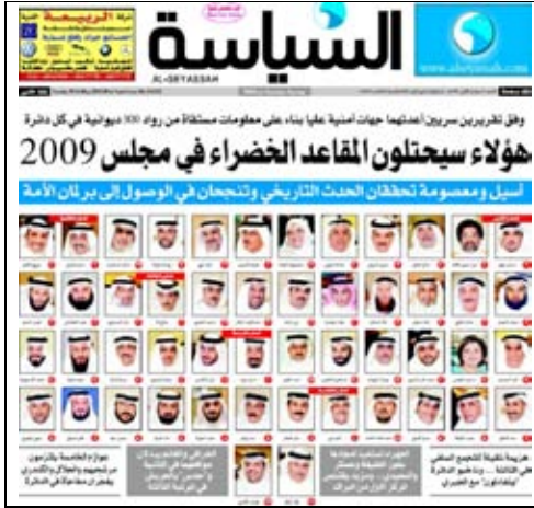
جريدة السياسة – 2009/5/10م