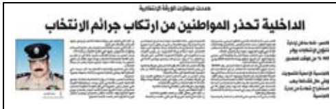
جريدة النهار – 2009/5/12م.

– في حين قامت الوزارة بطباعة قانون الانتخابات وتوزيعه على المرشحين ووسائل الاعلام والمهتمين بشكل عام.