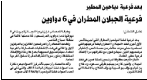
جريدة الدار – 2009/4/4م

إذن، كانت البداية في مرور فريعات انتخابات المجلس البلدي، ولو شعر الناس بجديّة منها – في حينها – لتردد كثير منهم في المشاركة في تنظيم فريعات مجلس الأمة، فكان هذا هو الضوء الأخضر الأول في السماح بإتجاز الفريعات، ثم كان الضوء الأخضر الثاني وهو تمرير فريعات أفخاذ عدد من القبائل لانتخابات مجلس الأمة التي أنجزت دون أي عوائق، علما بأن