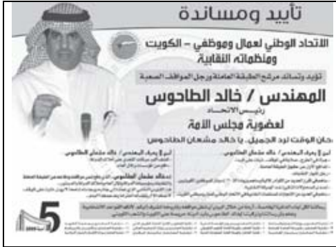
جريدة الوطن وجريدة الراي - 2009/5/15م.

الشؤون الاجتماعية والعمل أي إجراء تجاه هذه التجاوزات، ولو كان تحرك رئيس الاتحاد في قضايا تخص الاتحاد والعمال لكن مقبولاً دفاع الاتحاد والنقابات عن رئيسهم، أما أن يتم الزج بالاتحاد ويستخدم في حملة انتخابية على مستوى البرلمان فهو أمر غير قانوني، وتمنينا - في تقارير المفوضية الأسبوعية - على الزملاء في الاتحاد عدم استخدام منظمة نقابية لتحقيق أغراض شخصية.