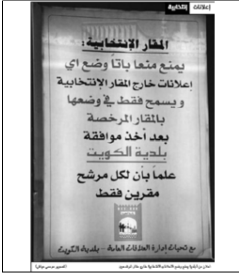
جريدة الراي - 2009/4/9م

وأمام هذا الإنجاز المميز فقد أشدنا في تقارير المفوضية بدور الفريق الخاص بمتابعة الانتخابات في بلدية الكويت برئاسة وزير الدولة لشئون البلدية د.فاضل صفر، حيث أكدت بلدية الكويت على وجوب التزام جميع المرشحين بالنظام الخاص بالمقار الانتخابية التي بدأ ترخيصها بعد فتح باب الترشيح، وأن إعلانات المرشحين خارج المقار الانتخابية، والإعلانات الأخرى على المنازل سيتم إزالتها جميعها ومخالفة أصحابها.. وقد فعلت، كما كان للبلدية دور إعلامي مميز في رصد المخالفات والإفصاح عنها مما زاد من الشفافية في أعمالها.