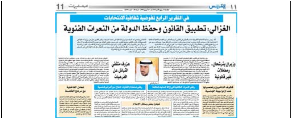
جريدة القبس - 2009/4/14م