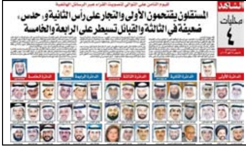
جريدة الشاهد – 2009/5/14م

بينما لا يوجد في الكويت أي تنظيم لاستطلاعات الرأي، لذلك لوحظ انتشار استطلاعات الرأي في هذه الانتخابات، كما لوحظ خطأ تلك الاستطلاعات في غالب الأحيان، فمثلاً إحدى الصحف نشرت دراسة وضحت فيها أسماء الناجحين في الانتخابات، وذلك في فترة تقل عن أسبوع من موعد الانتخابات، وقد كانت نسبة الخطأ فيها كبيرة للغاية وصلت الى 26% وهي بذلك لا تتسق مع أي معايير علمية في استطلاعات الرأي.