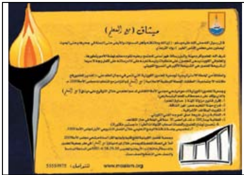
جريدة الوطن - 2009/4/26م.

قامت الجمعية بدور مميز في يوم الافتتاح في مختلف المراكز الانتخابية، حيث حضر متطوعوها في أماكن وجود الناخبين بهدف توفير خدمة الإسعافات تحسباً لأي طارئ، ولمساعدة كبار السن.