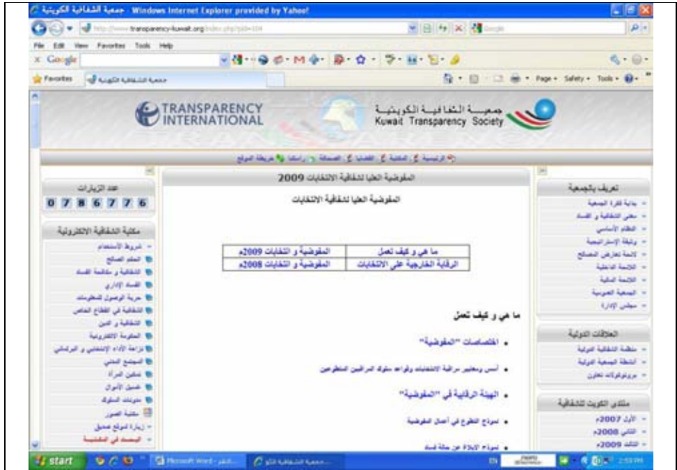
موقع جمعية الشفافية على الانترنت