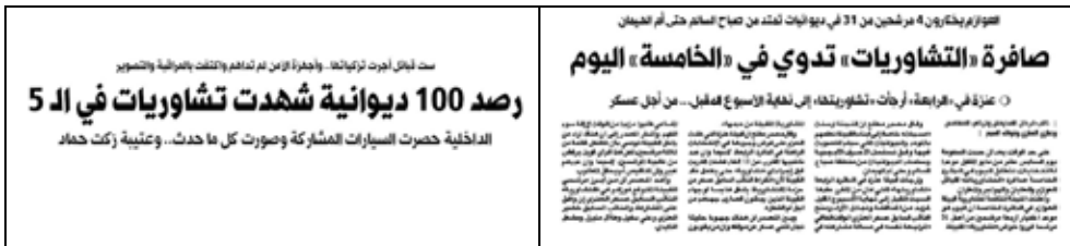
جريدة النهار – 2009/4/16م

فالدائرة الخامسة مثلاً، احتشدت فيها صفوف أكبر قبيلتين لكي تحصد كل منهما أربعة مقاعد – من أصل عشرة مقاعد – للحفاظ على ما حققتها في الانتخابات الماضية، مع سعي إحداها للحصول على مقعد خامس، وفي الدائرة الرابعة أيضا احتشدت صفوف قبيلتين لكي تحصد كل منهما أربعة مقاعد، مع سعي إحداها للحصول على مقعدين إضافيين من خلال مستقليها، فيما نجد في الدائرتين أن القبائل الصغيرة تجمع صفوفها لكسر سيطرة القبيلتين الكبيرتين، أما العائلات بمختلف فئاتها فتشعر أن فرصة فوز الكفاءات من أبنائها منعدمة، وتأثيرهم في التصويت لا وزن له، مما يدفعهم إلى مقاطعة الانتخابات.