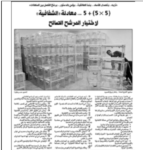
جريدة الراي - 2009/4/15م

– أعادت الجمعية نشر "معايير المرشح الصالح" (5+5x5) وتضم مجموعة من المواصفات التي يجب أن يتحلى بها – أو بأكثرها – النائب عن الشعب في مجلس الأمة، يمكن للناخب الاسترشاد بها، فيعمل على تقييم المرشحين، ويختار الشخصية الأكثر ملاءمة لشغل عضوية مجلس الأمة، ولقد شملت المعايير قيم النزاهة والشفافية واحترام القانون، والمؤهلات الشخصية من حيث الخبرة والكفاءة، والسمات الشخصية من حيث القيم الأخلاقية، والأطروحات الفكرية، والبرنامج الانتخابي، كما يجب أن يتعهد المرشح بخمسة أمور.. وقد تم التعاون مع تلفزيون الكويت لتصوير حلقات إعلامية تلفزيونية لكل معيار من هذه المعايير حيث تم بثها خلال البرامج اليومية، وهو دور إيجابي قامت به وزارة الإعلام.