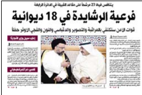
جريدة النهار - 2009/4/27م.

ومع صدور التقرير السادس للمفوضية بتاريخ 2009/4/27م انتهى موسم الانتخابات الفرعية لهذا العام بعد إتمام قبيلة الرشيدة لانتخاباتها الفرعية، حيث استطاعت جميع القبائل التي رغبت بتنظيم انتخابات فرعية إتمامها دون أي عوائق تذكر، وكان الملاحظ في انتخابات 2009 أن وزارة الداخلية لم تمارس أي دور في محاولة لمنع الجريمة الانتخابية، واكتفت برصدها ومحاولة جمع الأدلة وتقديمها إلى النيابة العامة، وهو أسلوب لا يمكن الحكم على جدواه إلا من خلال الأدلة التي قامت وزارة الداخلية بتجميعها ومدى الأخذ بها حين النظر فيها أمام القضاء 7 .