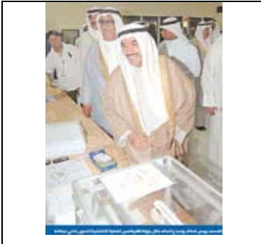
جريدة الجريدة - 2009/5/17م.