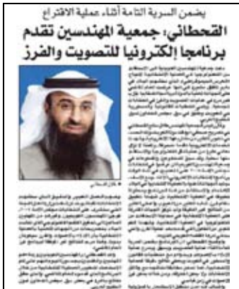
جريدة القبس - 2009/4/8م

في الاسبوع الرابع من الموسم الانتخابي كشفت الجمعية أن لديها برنامجا انتخابيا مجربا في عمليات التصويت ويلبي المتطلبات القانونية والدستورية في الكويت، ولئن كان هذا الجهد مشكورا للجمعية، إلا أن "ثقة" المرشحين في عمليات الفرز والبرنامج الإلكتروني المستخدم لذلك تأتي في المرتبة الأولى، وإلا فإن الجهات المعنية لا يمكنها الأخذ بالنظام الإلكتروني من دون ثقة مطلقة به، لذلك قد يكون من المناسب تطبيق النظام في انتخابات جمعيات النفع العام والجمعيات التعاونية، بالتنسيق مع وزارة الشؤون الاجتماعية والعمل، مما يشيع ثقة عامة بالنظام يمكن بعدها الانتقال بالتطبيق إلى انتخابات المجلس البلدي فمجلس الأمة.