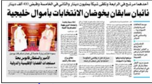
جريدة السياسة – 2009/5/7م

نشرت جريدة (الرؤية) يوم الأحد 2009/5/3 صورة لشيك باسم أحد المرشحين يتلقى قرابة مليون دينار من شخصية خليجية، كما نشرت صحف أخرى أبناء عن الموضوع نفسه وموضوع مرشح آخر، وناشدنا الجهات المعنية في وزارة الداخلية والبنك المركزي أن تتبع الموضوعين وتعمل على تأكيده أو نفيه، لأن هذا يشكل خطرا حقيقيا على الأمن الوطني للدولة.