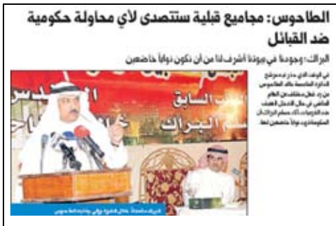
جريدة الجريدة - 2009/4/8م

وإذا كانت انتخابات 2009م لم تشهد - والله الحمد - مثل الأحداث التي شهدتها انتخابات 2008م والمتعلقة بالتدخل العسكري للتصدي للانتخابات الفرعية وردود الأفعال من الطرف الآخر، إلا أن الساحة الانتخابية شهدت ثلاثة أحداث كادت أن تؤدي إلى "العنف الانتخابي" شغلت الرأي العام بدرجات متفاوتة.