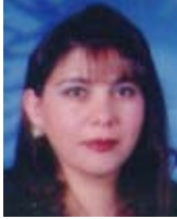
أ.د.معصومة احمد ابراهيم

يدير أعمال "المفوضية العليا لشفافية الانتخابات" هيئة رقابية تتكون من الأشخاص التالية أسماؤهم: