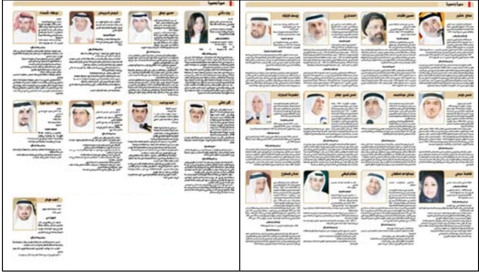
جريدة الدار – 2009/5/16م.

– من الملاحظات "الطائفية" قيام إحدى الصحف اليومية بنشر السيرة الذاتية لعدد من المرشحين في جميع الدوائر الانتخابية، لا يجمع بينهم سوى الانتماء للطائفة الشيعية، وهو أمر نتمنى أن تتجنبه صحافتنا الكويتية.