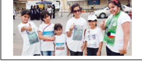
جريدة القيس - 2009/5/17م.